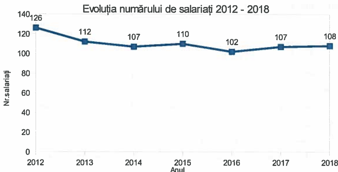
Tabel 1.2 – Evoluția numărului de salariați

Fluctuația de personal în anul 2018 s-a menținut în limite considerate normale, de până la 25%. În cursul anului 2018 au fost angajate 12 persoane, iar din cadrul societății au plecat 8 persoane, după cum urmează: